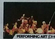
PERFORMING ART (DHO)